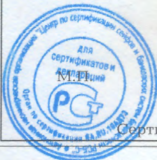
Схема сертификации - 1